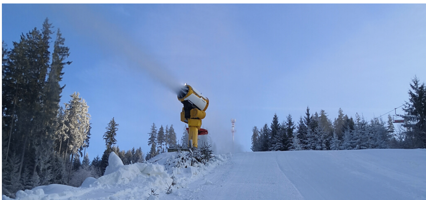
Zasněžování velkého padáku na sjezdovce FIS

Přípravku čekají první závody začátkem ledna.