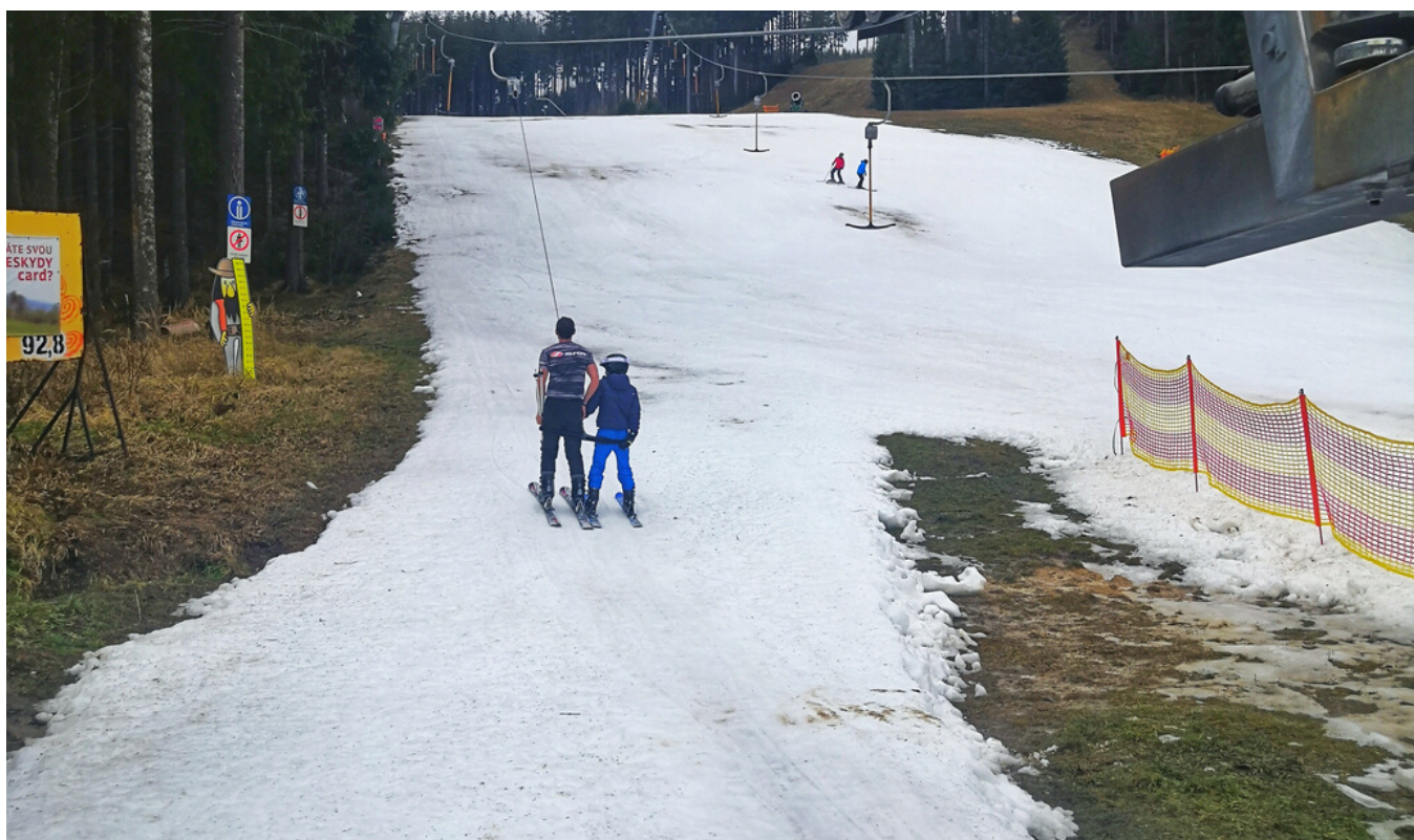
Jarní lyžování na Jihu v krátkém tričku a 10°C 21. prosince 2019