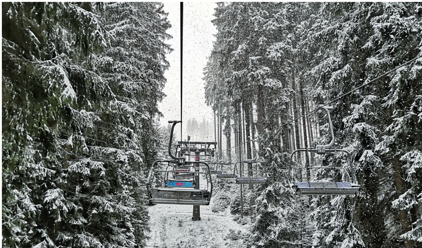
Sněhová nadílka na Bílé 13. prosince 2019